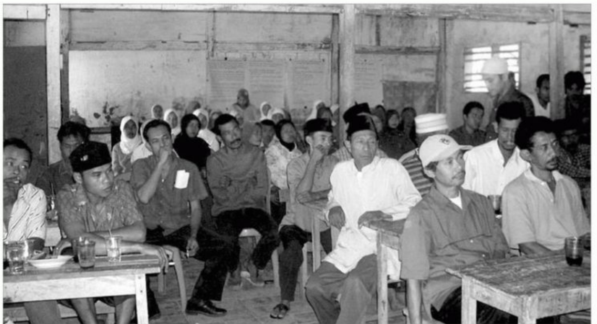
Sejumlah warga di Kabupaten Lebak saat mengikuti sosialisasi pelaksanaan Program Nasional Pemberdayaan Masyarakat (PNPM) Mandiri yang digelar Badan Pemberdayaan Perempuan dan Masyarakat Desa, beberapa waktu lalu.

Terpisah, Kepala BPPMD Provinsi Banten Sigit Suwitaro menambahkan, sasaran program ini adalah terciptanya swadaya masyarakat dalam pembangunan desa, tersedianya daya dukung sarana dan prasarana kegiatan sosial ekonomi, serta terlaksananya proses pengambilan keputusan oleh masyarakat dalam hal perencanaan, pelaksanaan, pemantauan, dan pengawasan serta pemanfaatan dan pemeliharaan hasil-hasil dari kegiatan yang didanai oleh bantuan desa tersebut. “Pembangunan infrastruktur yang bisa dibangun oleh bantuan keuangan desa adalah jalan desa, jembatan, irigasi, penyediaan air bersih, serta penambahan perahu nelayan dan sarana gedung seperti, mushala,” beber Sigit. (*)