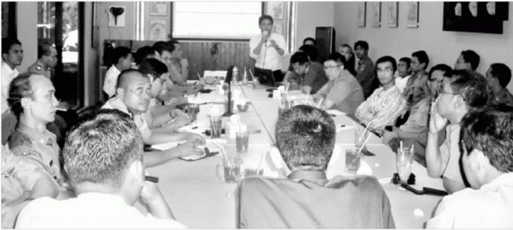
KPU Tangsel ketika menggelar rapat koordinasi dengan sejumlah instansi yang membahas persiapan dan lokasi kampanye Pilkada di KPU Tangsel, Senin (4/10).