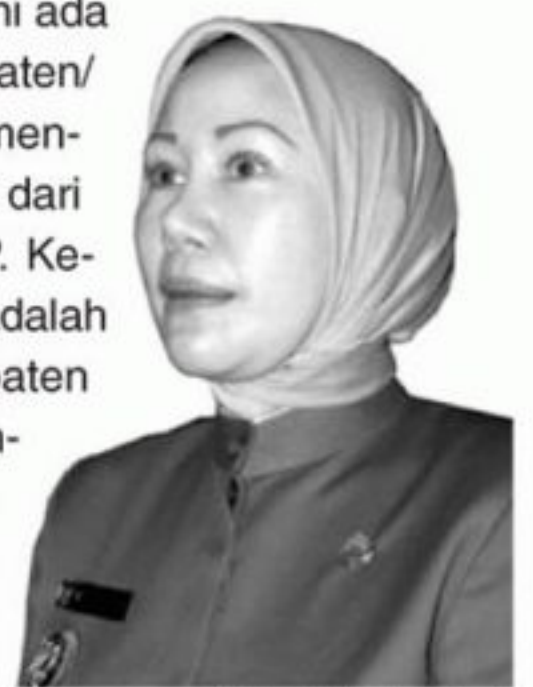
Ratu Atut Chosiyah Gubernur Banten

“Tahun ini ada lima kabupaten/kota yang mendapat BLM dari PNPM-MP. Kelimanya adalah Kabupaten Lebak, Pandeglang, Tangerang, Serang, dan Kota Tangsel