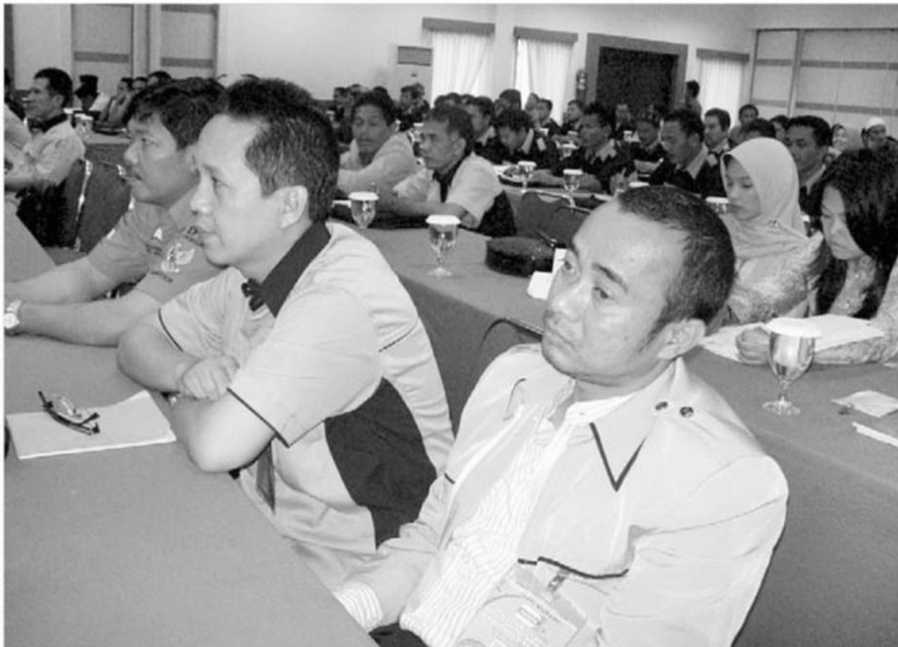
Sejumlah pengurus dan kader DPC Partai Hanura Kabupaten Serang mengikuti Musyawarah Cabang (Muscab) I di Hotel Patrajasa Anyer, Minggu (4/10).