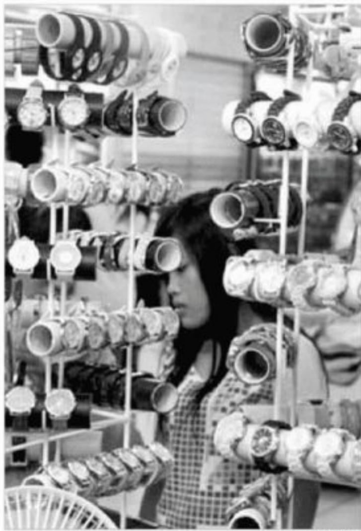
JAM TANGAN - Seorang pengunjung mal tengah memperhatikan jam tangan dengan beragam merek yang ditawarkan sejumlah toko di pusat perbelanjaan di Kota Cilegon. Jam tangan dengan berbagai model ini menjadi menarik dengan beragam pilihan warnanya.