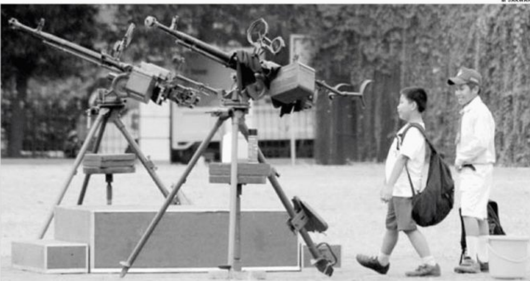
PERSIAPAN HUT TNI

Dua orang siswa sekolah dasar asik mengamati sejumlah peralatan militer yang dipajang di lapangan Ahmad Yani, Kota Tangerang, sebagai persiapan untuk menggelar apel HUT TNI ke 65, Senin (4/10).