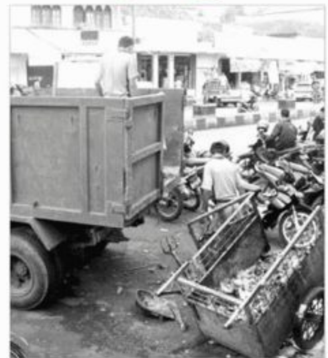
Sejumlah petugas kebersihan mengangkat sampah di depan Pasar Badak Pandeglang, Senin (4/10).