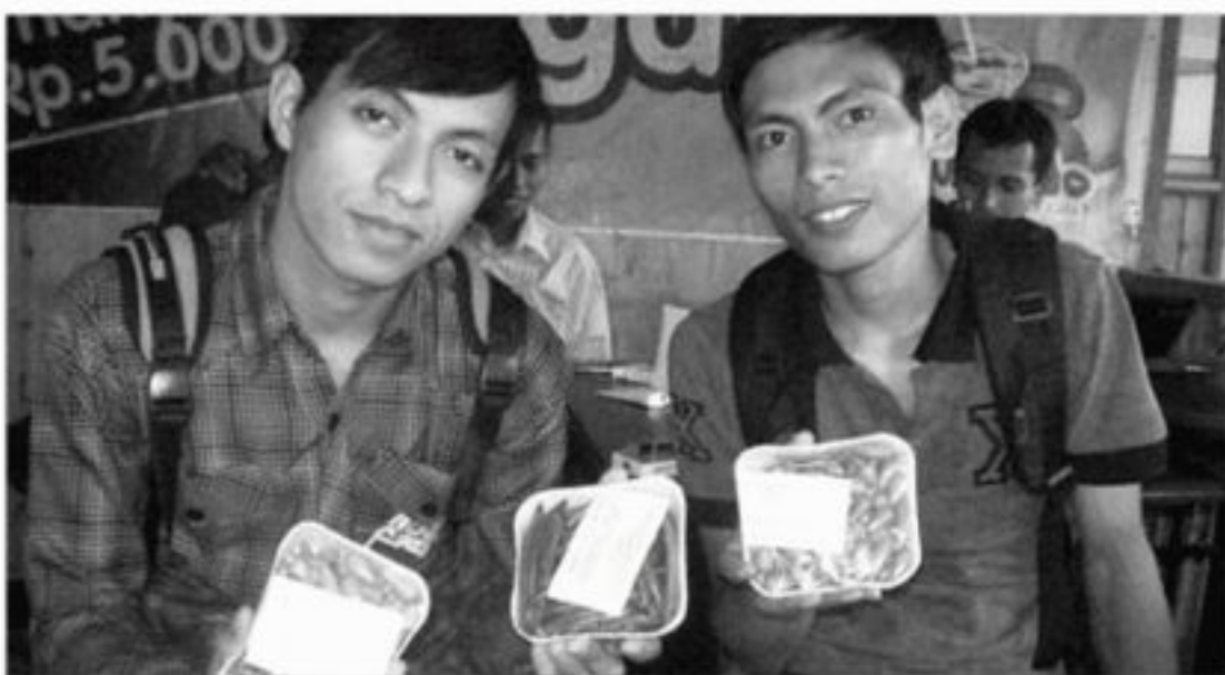
Dua mahasiswa dari Kelompok Pertanian Terpadu Bougenville Medalsari menunjukkan hasil pertanian mereka, Senin (4/10).