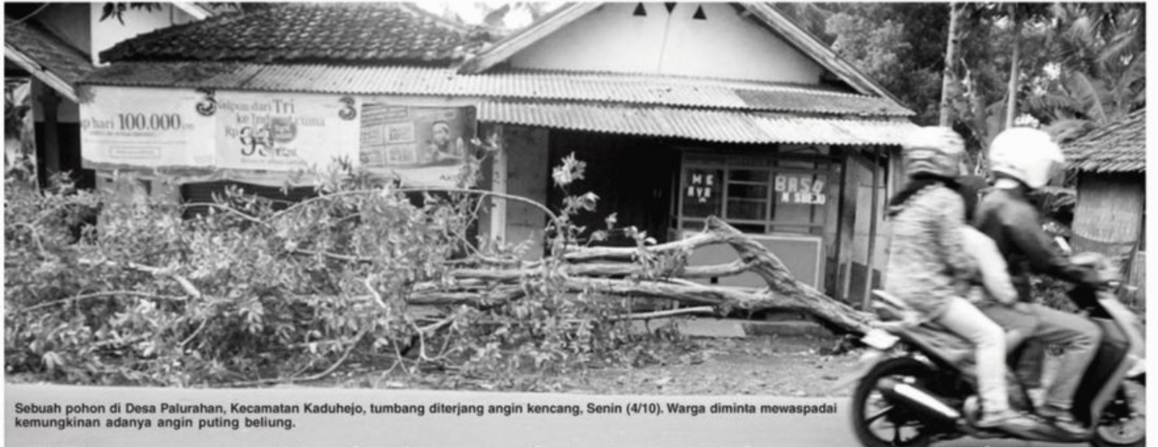
Sebuah pohon di Desa Palurahan, Kecamatan Kaduhejo, tumbang diterjang angin kencang, Senin (4/10). Warga diminta mewaspada kemungkinan adanya angin puting beliung.