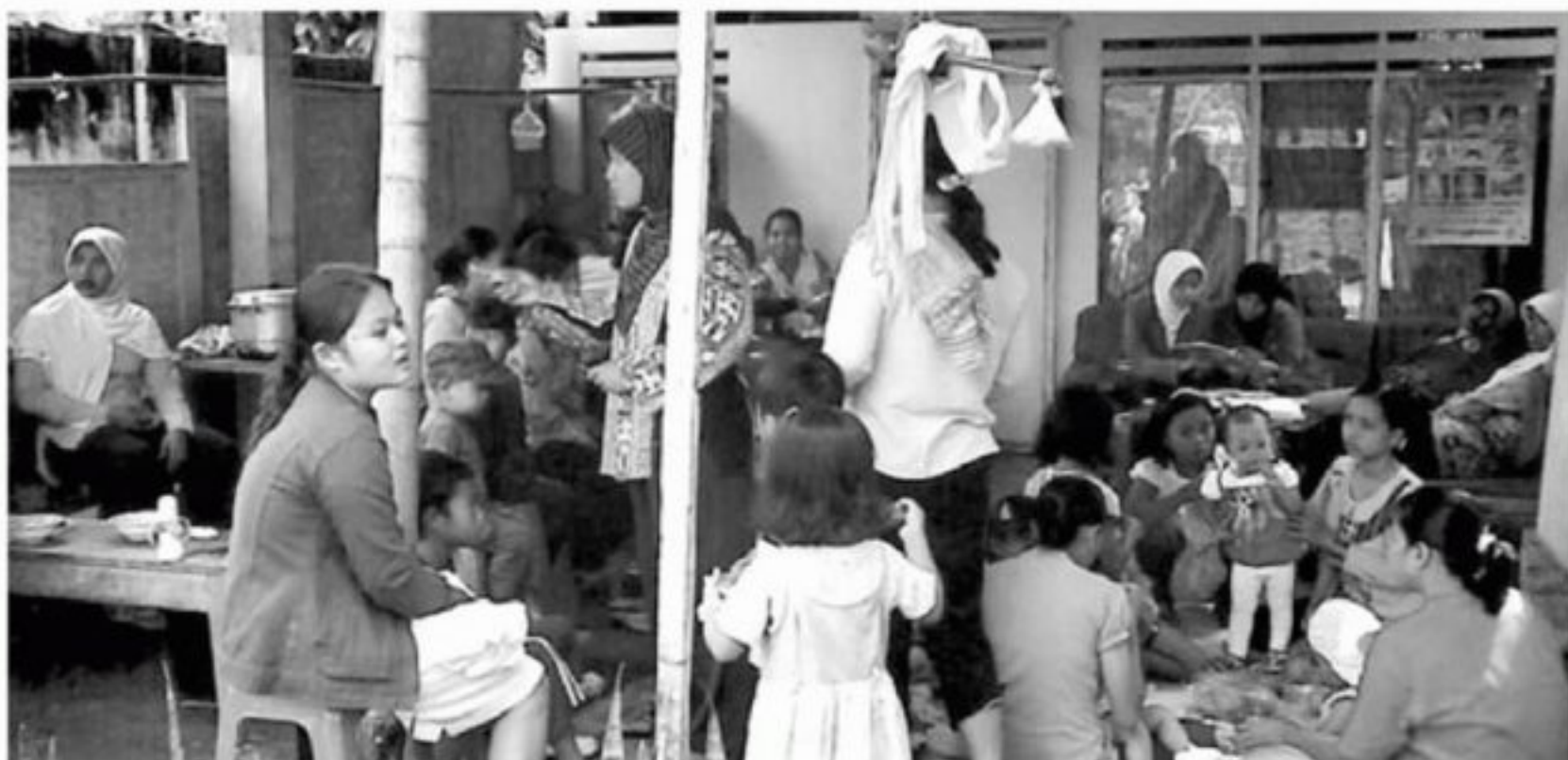
Posyandu di Kabupaten Tangerang aktif melaksanakan kegiatan kepada warga sekitar. Untuk mengoptimalkan gungsi posyandu Pemprov mengalokasikan dana khusus berupa hibah untuk kader posyandu.