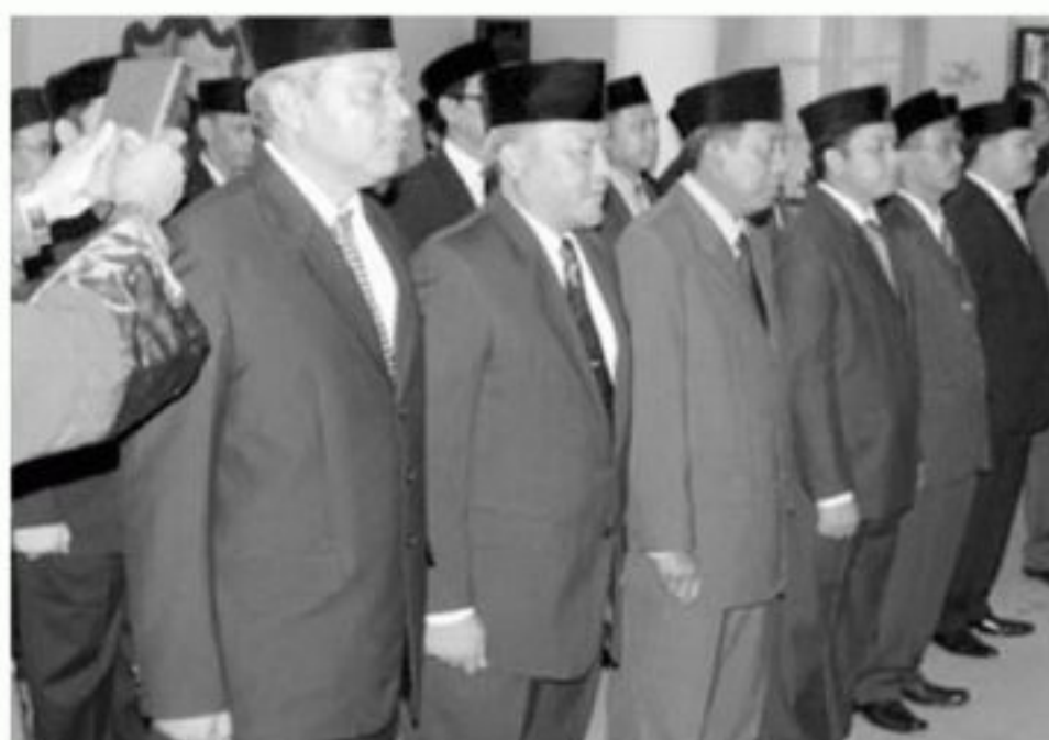
Sebanyak 24 pejabat eselon II Pemprov Banten, Kamis (7/10), dilantik Gubernur Banten Ratu Atut Chosiyah, sebagai bagian dari rotasi, rotasi, dan promosi jabatan.