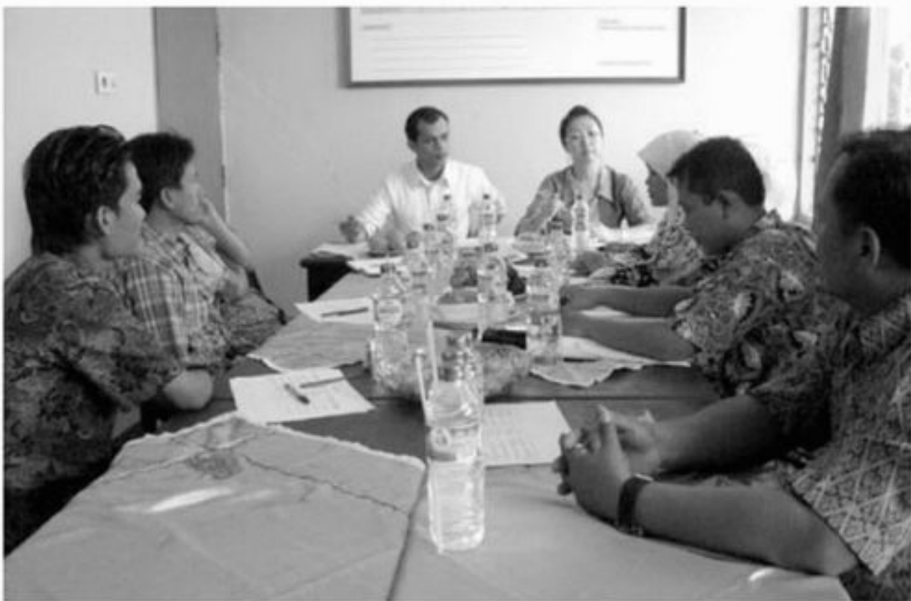
Suasana monitoring PELITA-JICA di UPTD Kecamatan Cikande, Kabupaten Serang.

Dengan bantuan PELITA-JICA, TPK Kecamatan Cikande dinilai sudah mandiri dalam berbagai kegiatan. Penilaian yang cukup bagus ini berkat kerja sama semua elemen masyarakat yang ada. Diharapkan, meski pada tahun depan program serupa tak lagi didanai oleh PELITA-JICA karena menjadi tanggung jawab Pemerintah Daerah (Pemda), namun program itu harus tetap berjalan dengan baik. (ADV)