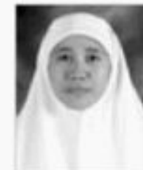
TUTIL ELFITA Anggota DPRD Provinsi Banten