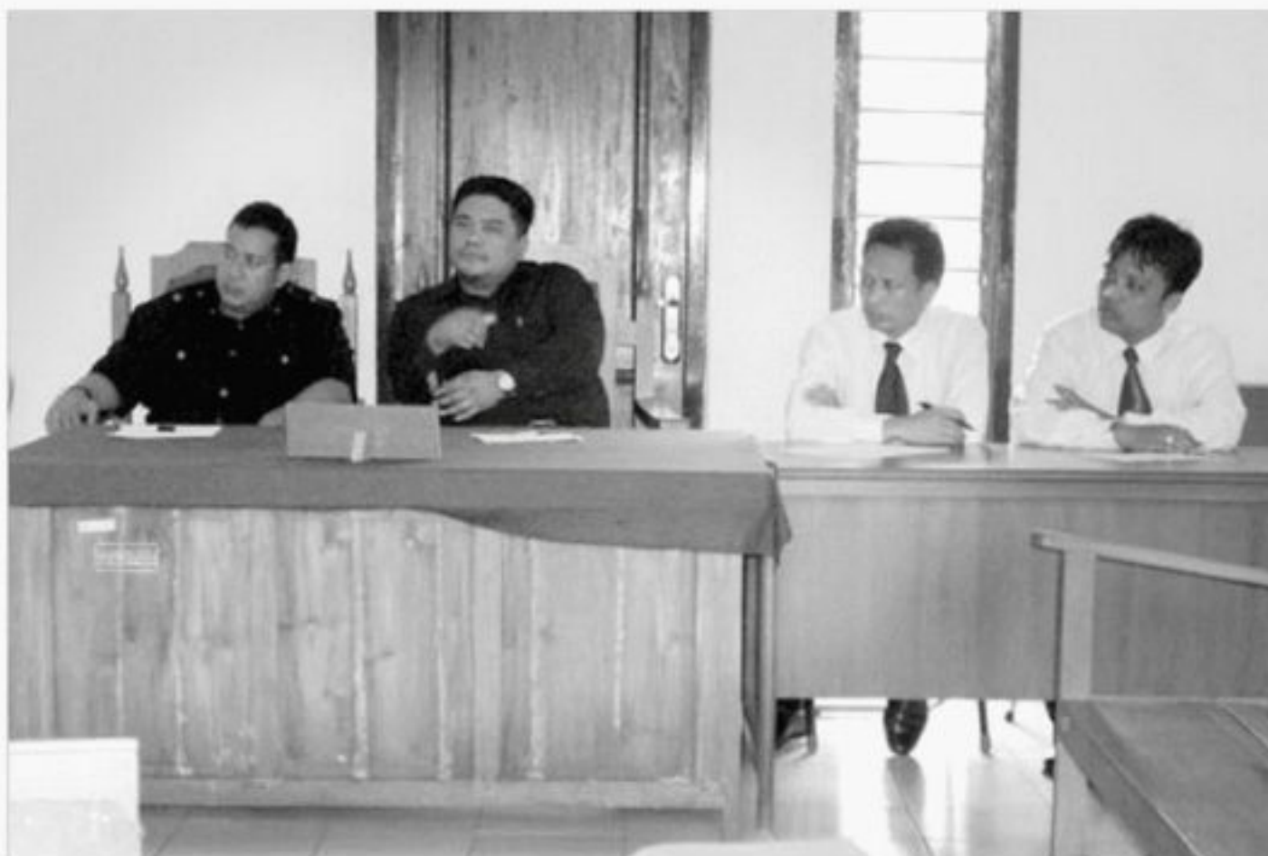
Para termohon ketika mendengarkan putusan hakim dalam sidang praperadilan di PN Serang, Senin (4/10).