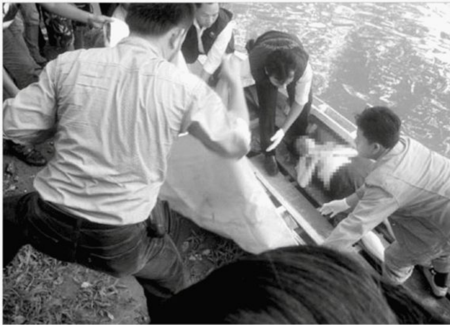
Warga dan petugas mengevakuasi korban dari Sungai Cisadane, Senin (4/10). Wanita ini diduga bunuh diri dengan nyebur ke sungai. Belum diketahui motifnya.

TANGERANG - Warga sekitar bantaran Sungai Cisadane di Jalan Proklamasi, Kelurahan Babakan, Kota Tangerang, dikejutkan dengan aksi seorang wanita yang diperkirakan berusia di atas 40 tahun, Senin (4/10). Wanita tanpa identitas tersebut diduga menceburkan diri hingga tewas. Mayatnya ditemukan mengambang pada sekira pukul 15.00 WIB.